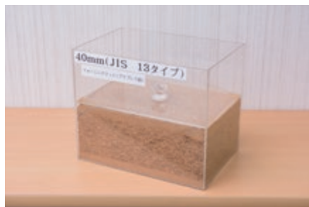
プレス前のフォーミング状況サンプル