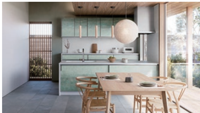
商品名：システムキッチン レミュー (LEMURE)

研ぎ澄まされたラグジュアリー 機能もデザインも、本物だけを ホーローなのに、マットな質感