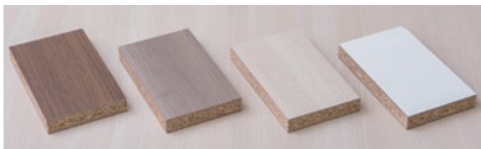
“日鉄テックスエンジニアフィンボード”

当社の“日鉄テックスエンジニアフィンボード”は木質ボード製品の中では“パーティクルボード”に分類されており、木質原料を加工して出来た素材として建築や家具・住宅内装に使用されている。天然木材に由来する元来の特徴に加え、加工により木質の欠点を取り去って新しく得られる特性を活かした、安価で目的に適した材料として広く利用いただいている。