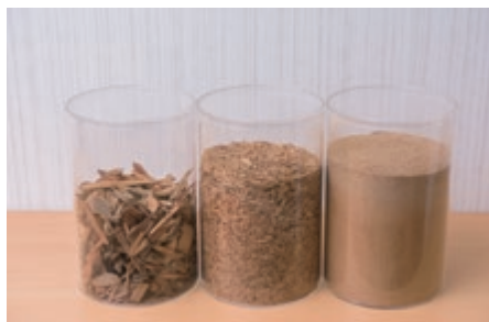
廃木材再生チップ100%の原料

当社の製品“日鉄テックスエンジファインボード”の生産の持続的な展開には、木材資源を有効活用して森林成長とのバランスに努めることが重要である。