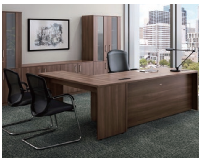
製品シリーズ: グレースライン 製品名: 役員什器