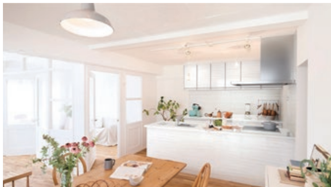
商品名：システムキッチン トレーシア (Treasia)