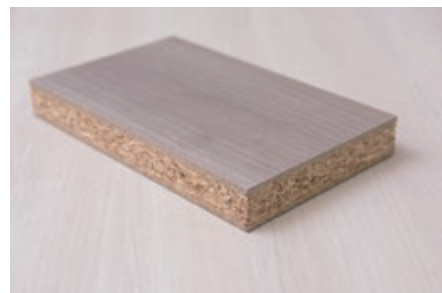
3層構造製品ボードの一例