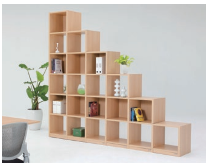
製品シリーズ: プロセルバ 製品名: ブロック収納