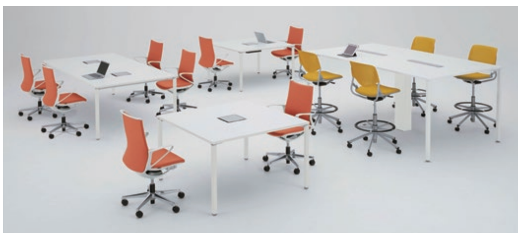
製品シリーズ: アクションフリー2 製品名: メインテーブル スクエア (ロータイプ・ハイタイプ)

天板のコア材 表面に高圧メラミン、裏面にバッカー材を貼り対傷性に優れている シンプルデザイン・フレキシブルなオフィスシステム レイアウト・組み合わせが自由自在